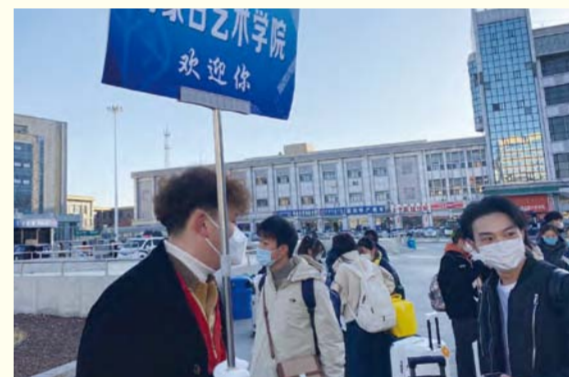
学校安排专门人员和车辆接站