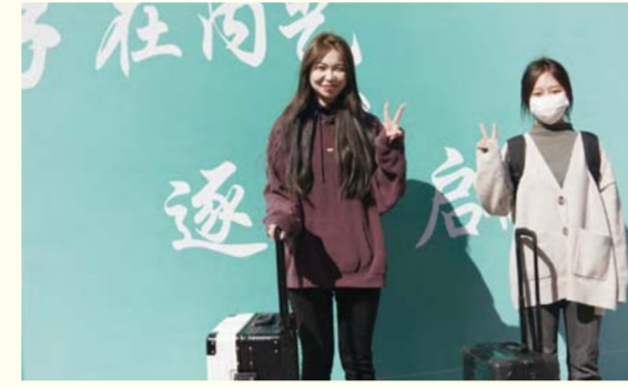
难得的开学的欣喜