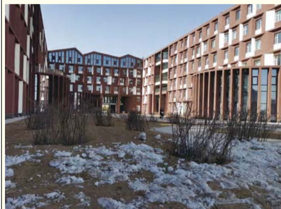
学生宿舍楼前的冰雪已在融化