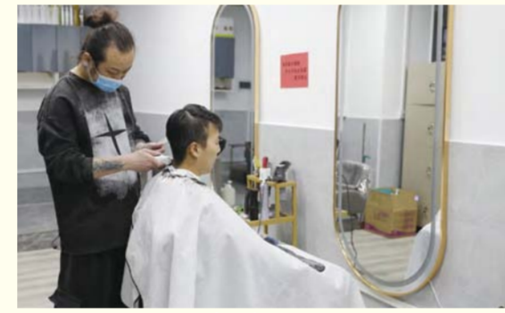
新学期来个新发型