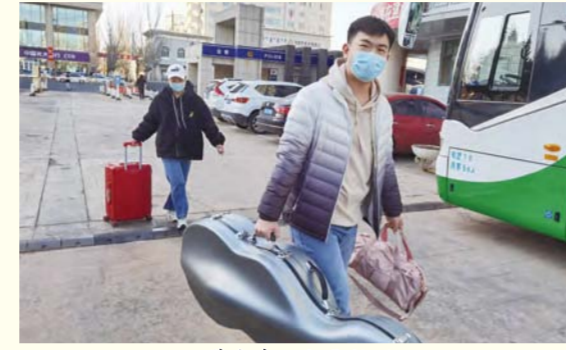
学生步入新华校区