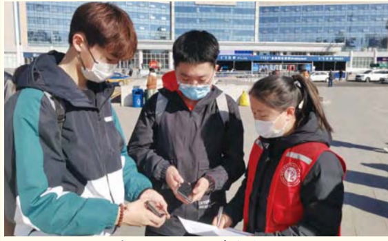
专人接站确保学生安全