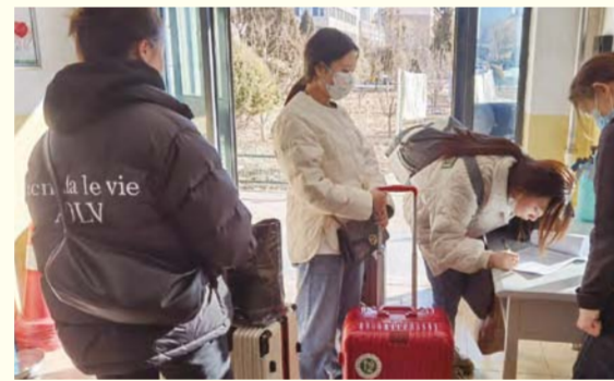
入宿登记，又回家了！