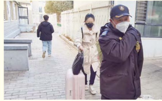
保卫处工作人员帮助学生搬运行李