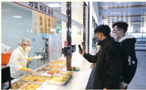
又吃到了学校可口的饭菜