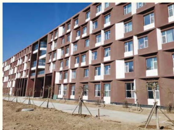
学生宿舍楼前种植上了小树